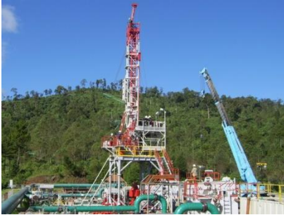
Rig 142K Long Stroke with Super Jack, type Hydra Rig Design

The following is a visual of some of the main equipment we have in relation to the Company's business.