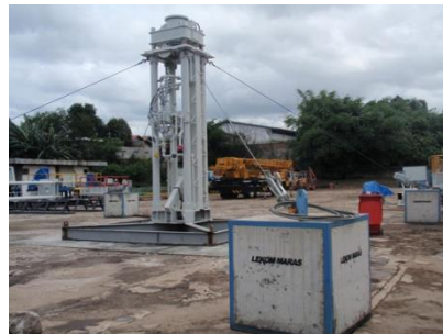
Rig 225K Short Stroke, type Hydra Rig Design