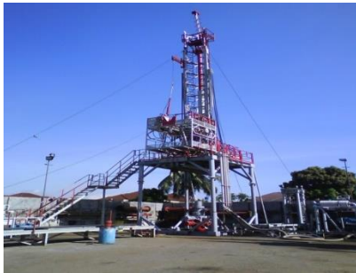
Rig 142K Long Stroke, type Hydra Rig Design