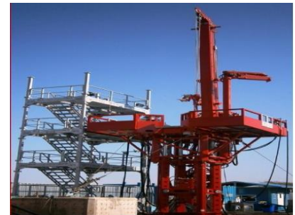
460K Short Stroke, type CEEM Advanced Hydraulic Work Over Unit