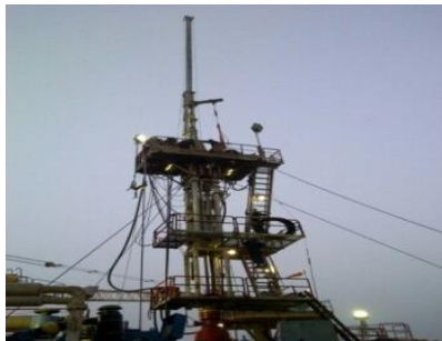
340K Short Stroke, type Snubbing Hydra Rig Design