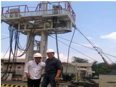
Rig 340K Short Stroke, type Hydra Rig Design